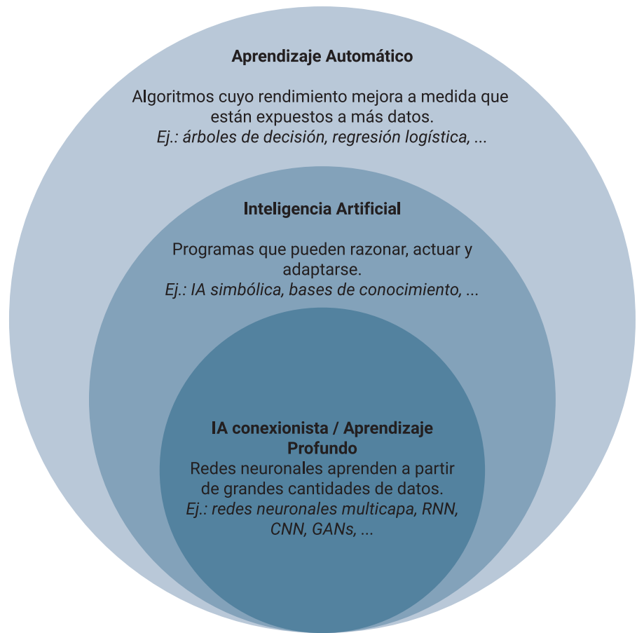
Figura 2. Diagrama de Venn que muestra la relación entre distintas subáreas de la inteligencia artificial.

Desde que el aprendizaje profundo recuperó prominencia alrededor del 2010, los softwares gratuitos y de código abierto especializados para el aprendizaje profundo han sido enormemente responsables de impulsar el campo hacia adelante. Desde las primeras librerías