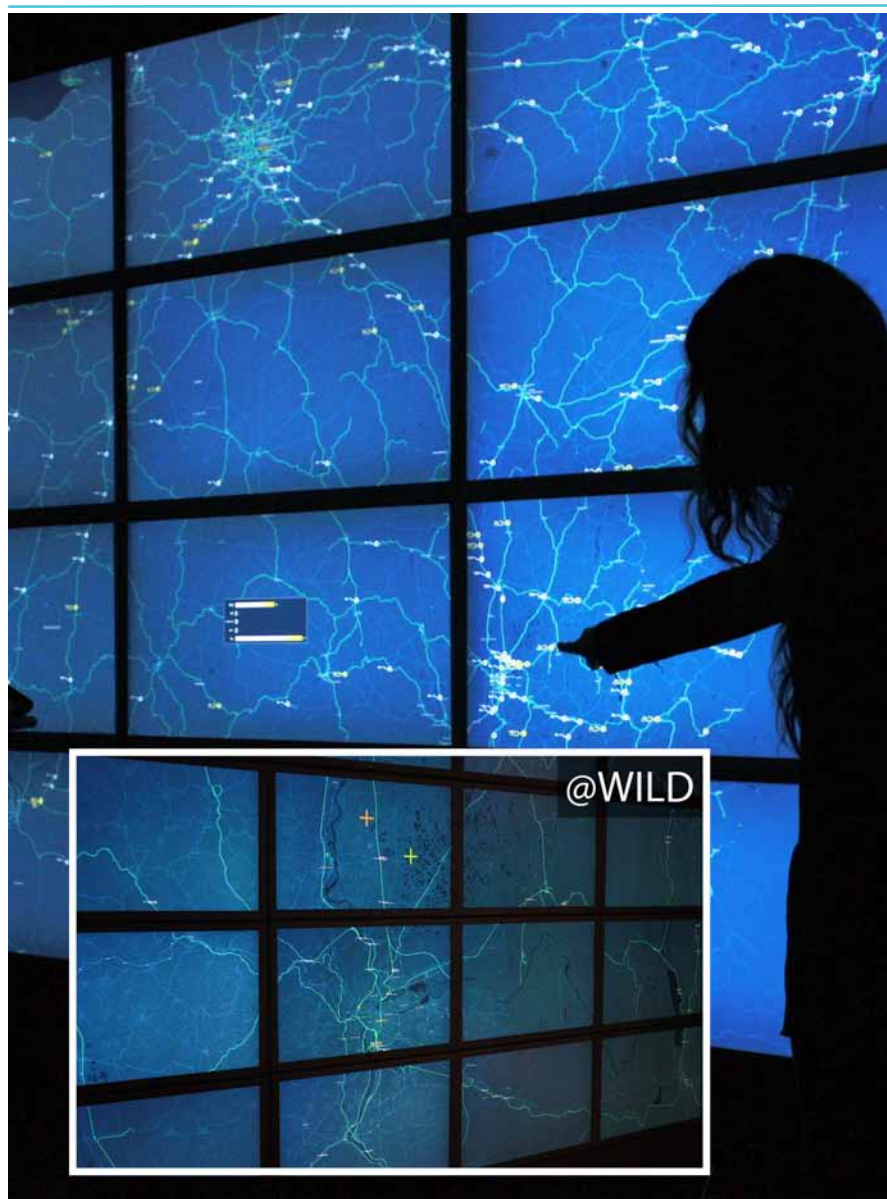
FIGURA 2. APLICACIÓN QUE PRESENTA EL ESTADO DE LOS TRENES EN TIEMPO REAL EN FRANCIA, CON DATOS DE WWW.RAILDAR.FR LA INTERACCIÓN SE REALIZA MEDIANTE UNA TABLET UTILIZANDO SMARTIES.

mediante los llamados pucks. Estos objetos circulares se comportan como una extensión del mouse y permiten manipular los objetos presentes en el muro. Igualmente, se pueden compartir entre los diferentes usuarios creando así un ambiente colaborativo.